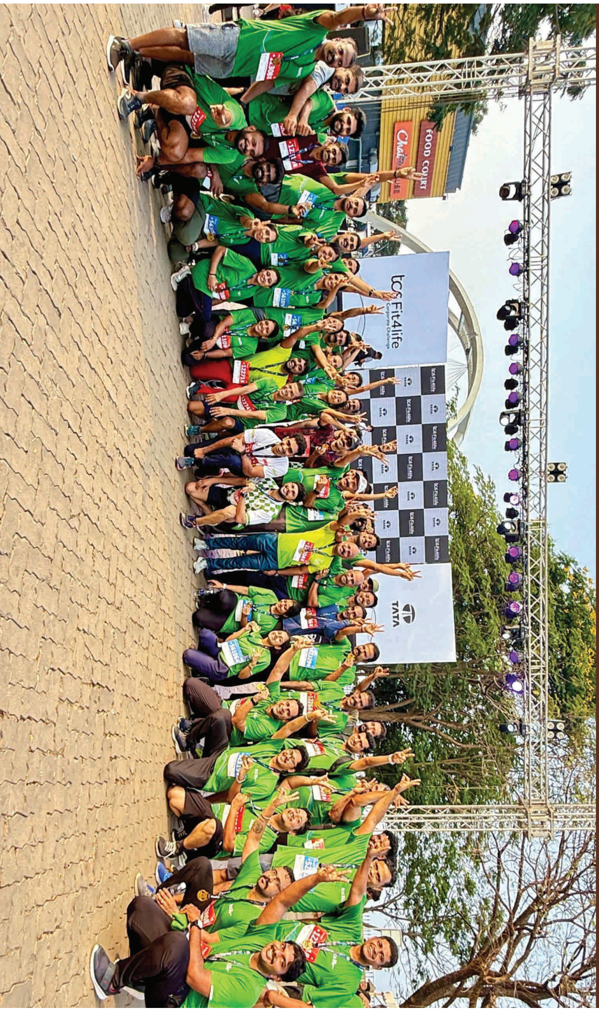
CIAL team @ TCS Fit for Life Corporate Challenge Marathon