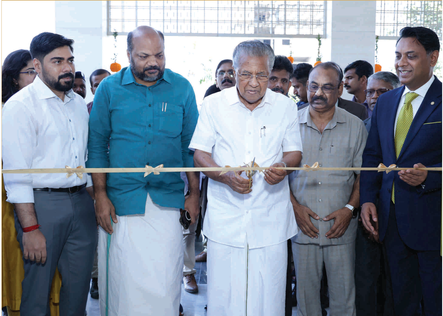
CM, Shri. Pinarayi Vijayan inaugurating Taj Cochin International Airport