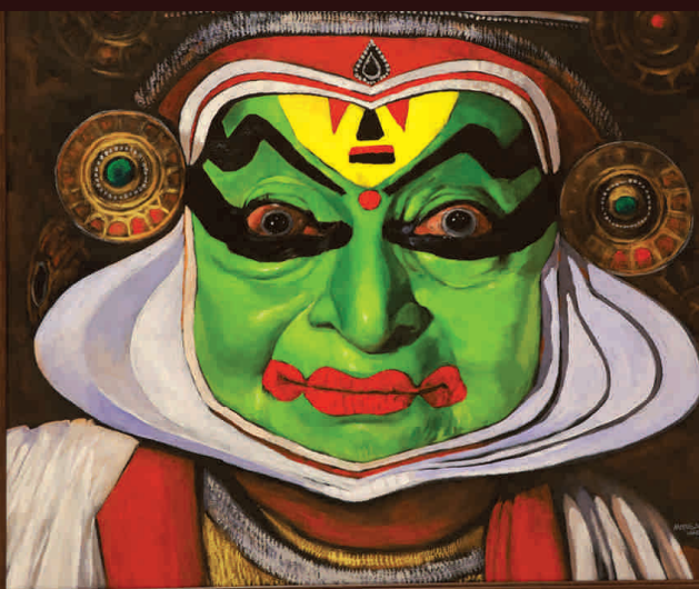
അദ്ഭുതം - अद्भुतः - Adbhutah (Wonder)