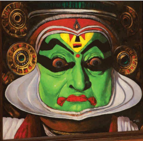
രൗദ്രം - रौद्रः - Raudrah (Anger)