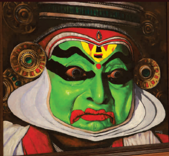
ഭയാനകം - भयानकः - Bhayanakah (Terrifying)