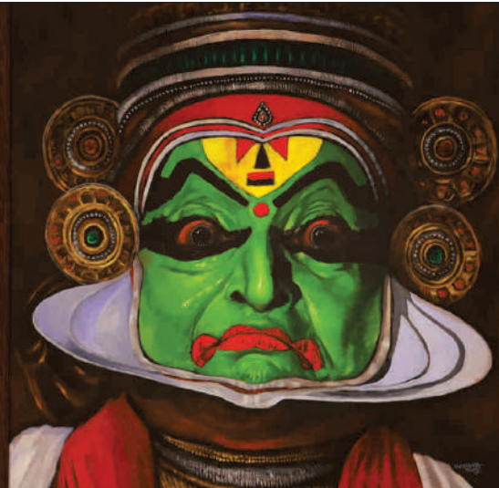
വീരം - वीरः - Virah (Valour)