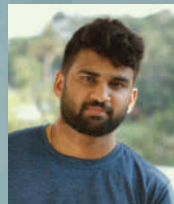
Sketch by Gokul M. Kartha Jr. Asst. Security