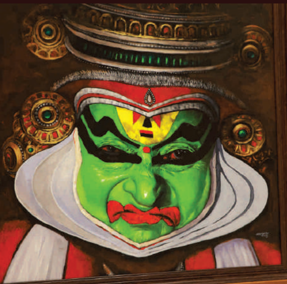
ബീഭത്സം - बीभत्सः - Bibhatsah (Disgust)