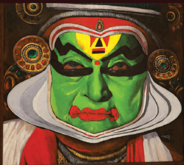
ശാന്തം - शान्तः - Santah (Tranquility)